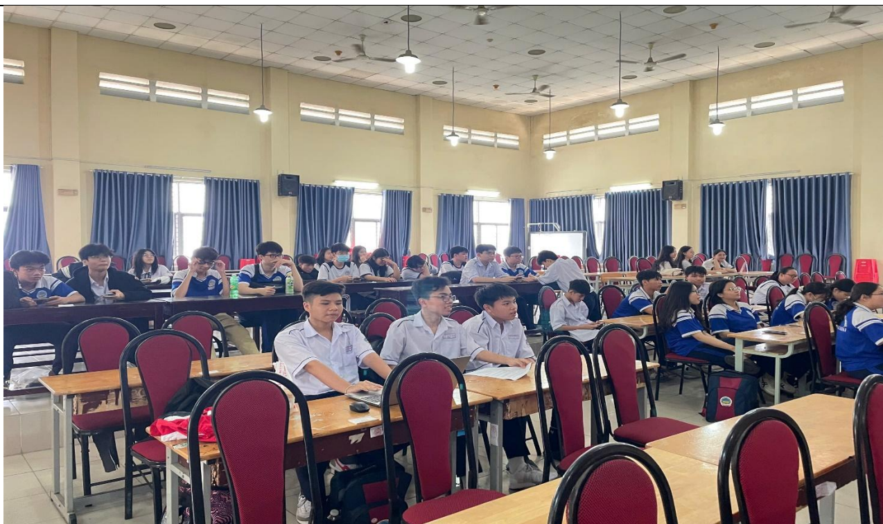
Hình 3: Các bạn học sinh chăm chú lắng nghe những bài thuyết trình của lớp bạn và mong chờ đến lượt trình bày của chính mình.

The students listened attentively to their peers' presentations while eagerly awaiting their turn to present.