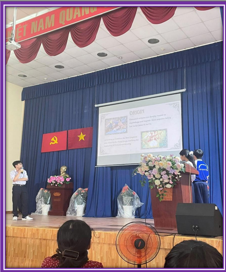
10A19 - VIETNAM'S HISTORY