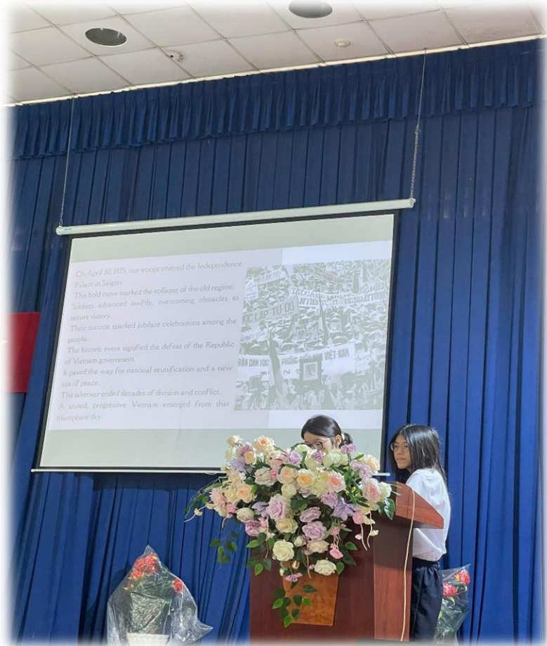
10A16 - DAY OF LIBERATING THE SOUTH FOR NATIONAL REUNIFICATION