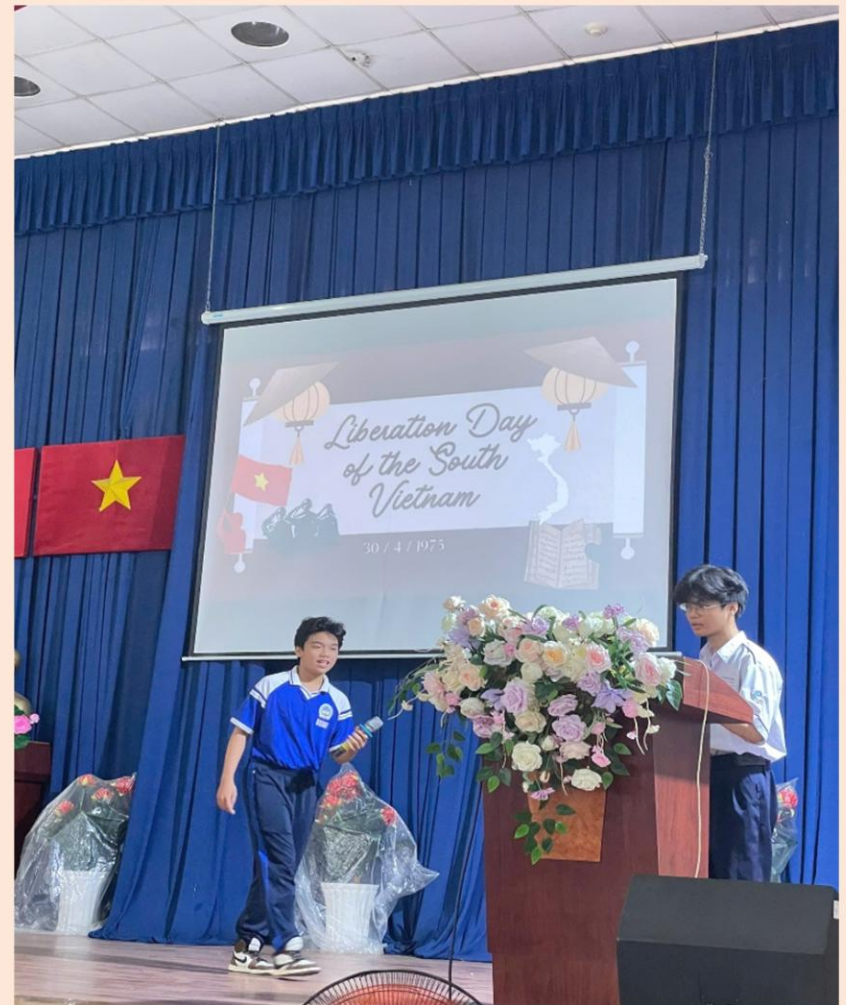
10A8 - LIBERATION DAY OF THE SOUTH VIETNAM