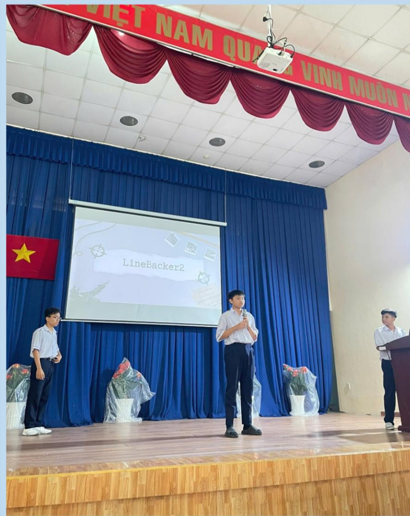
10A7 - LINEBACKER 2