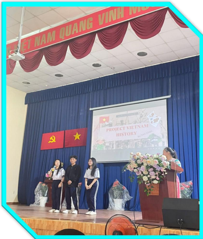
11A4 - THE BATTLE OF DIEN BIEN PHU