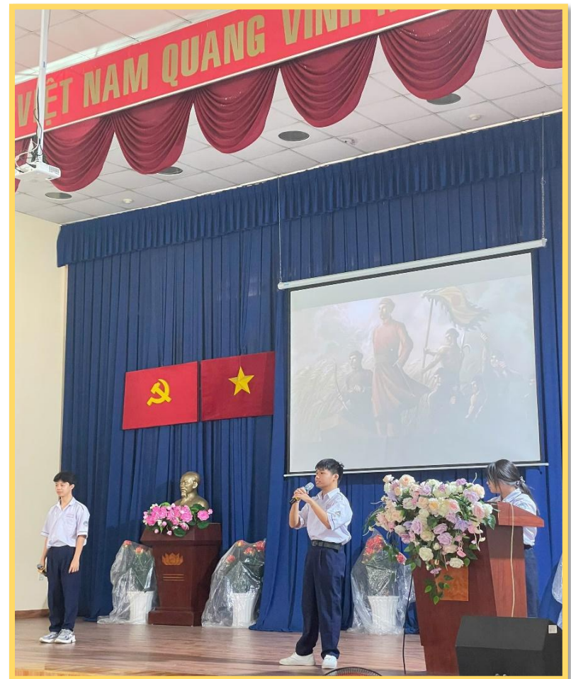
10A17 - THE TRAN DYNASTY