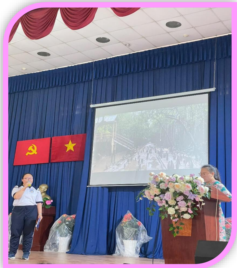
11A3 - THE BATTLE OF THE SAC FOREST COMMANDOS