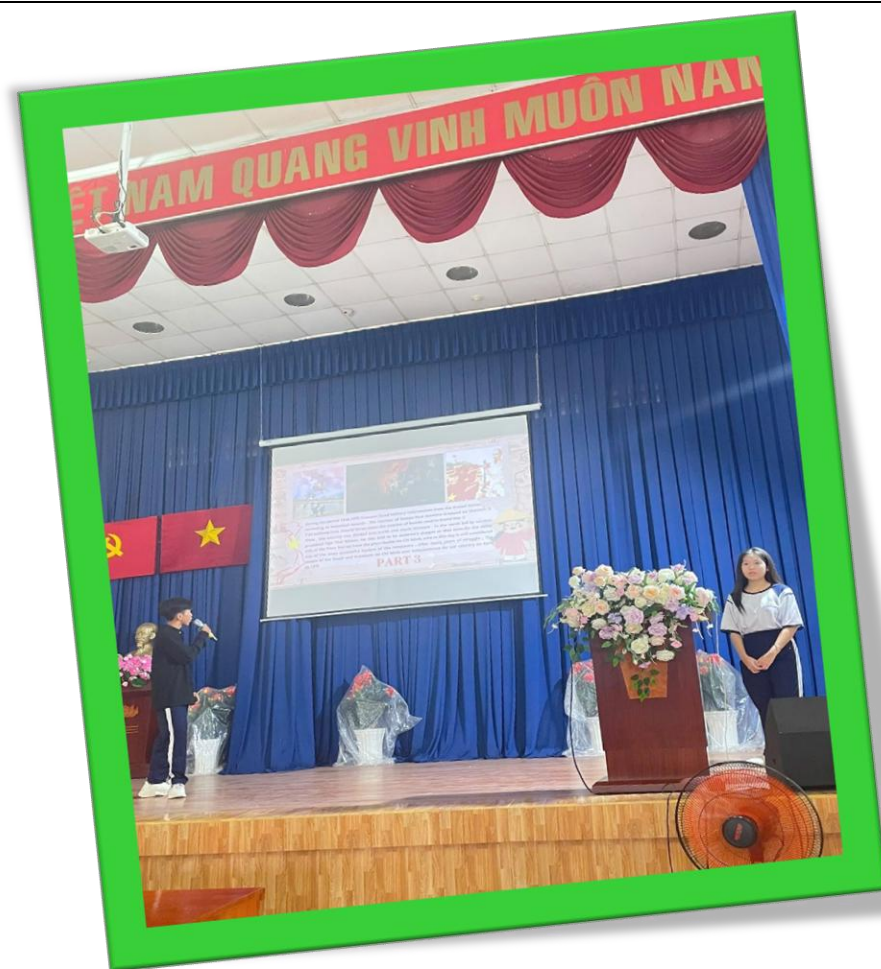
11A11 - THE VIETNAMESE HISTORY